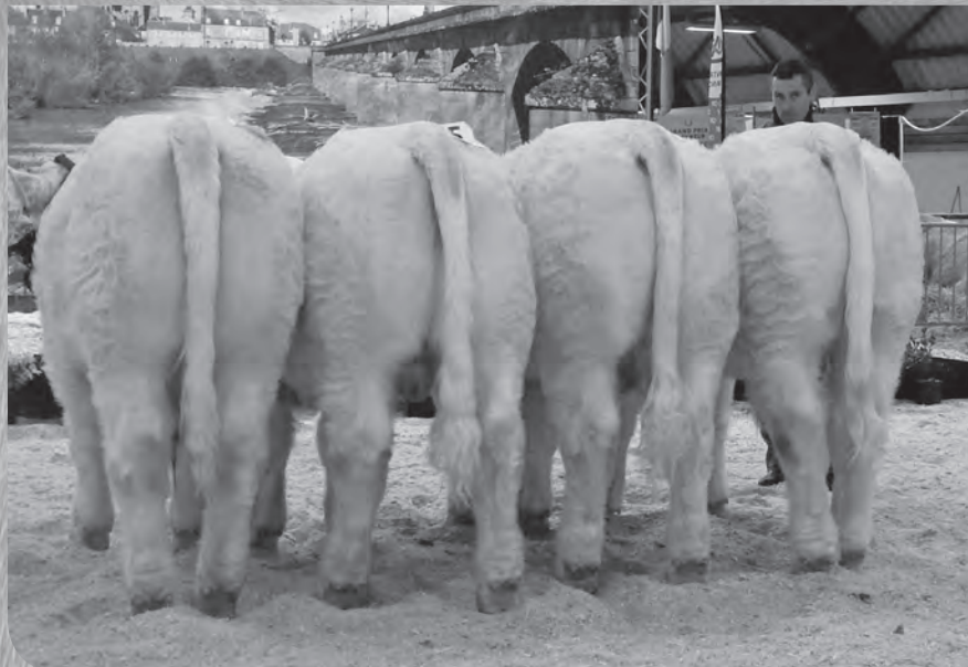
Prix d'ensemble Mâles des étables de plus de 80 vaches.