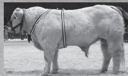
LABOR Prix d'Honneur Mâles Junior.