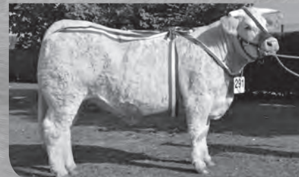
JOCONDE Prix Championnat Femelle Junior Concours.